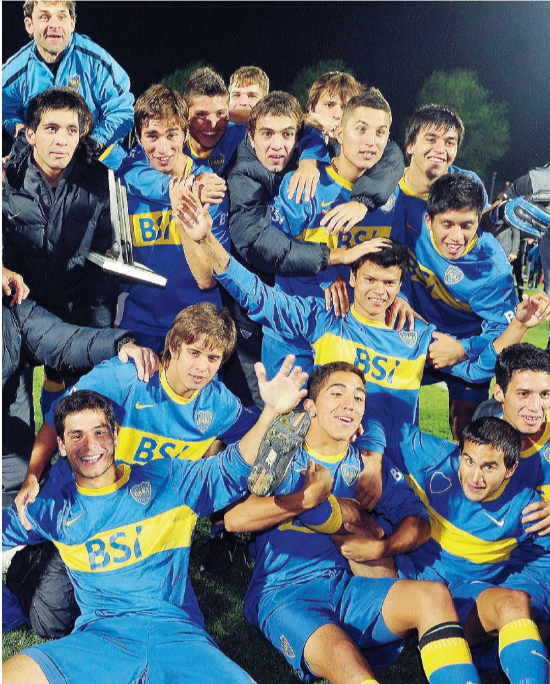
Il Boca Juniors vincitore nel 2012

L'impresa è stata in effetti molto complessa, irta di difficoltà, ma ora ce l'abbiamo fatta, e siamo sicuri che questo ritorno servirà da base e da garanzia per poter guardare con fiducia anche alle prossime edizioni.