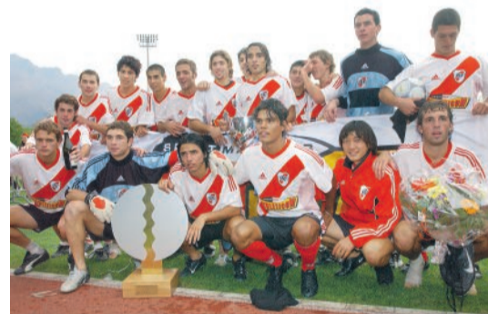
2003, trionfo del River